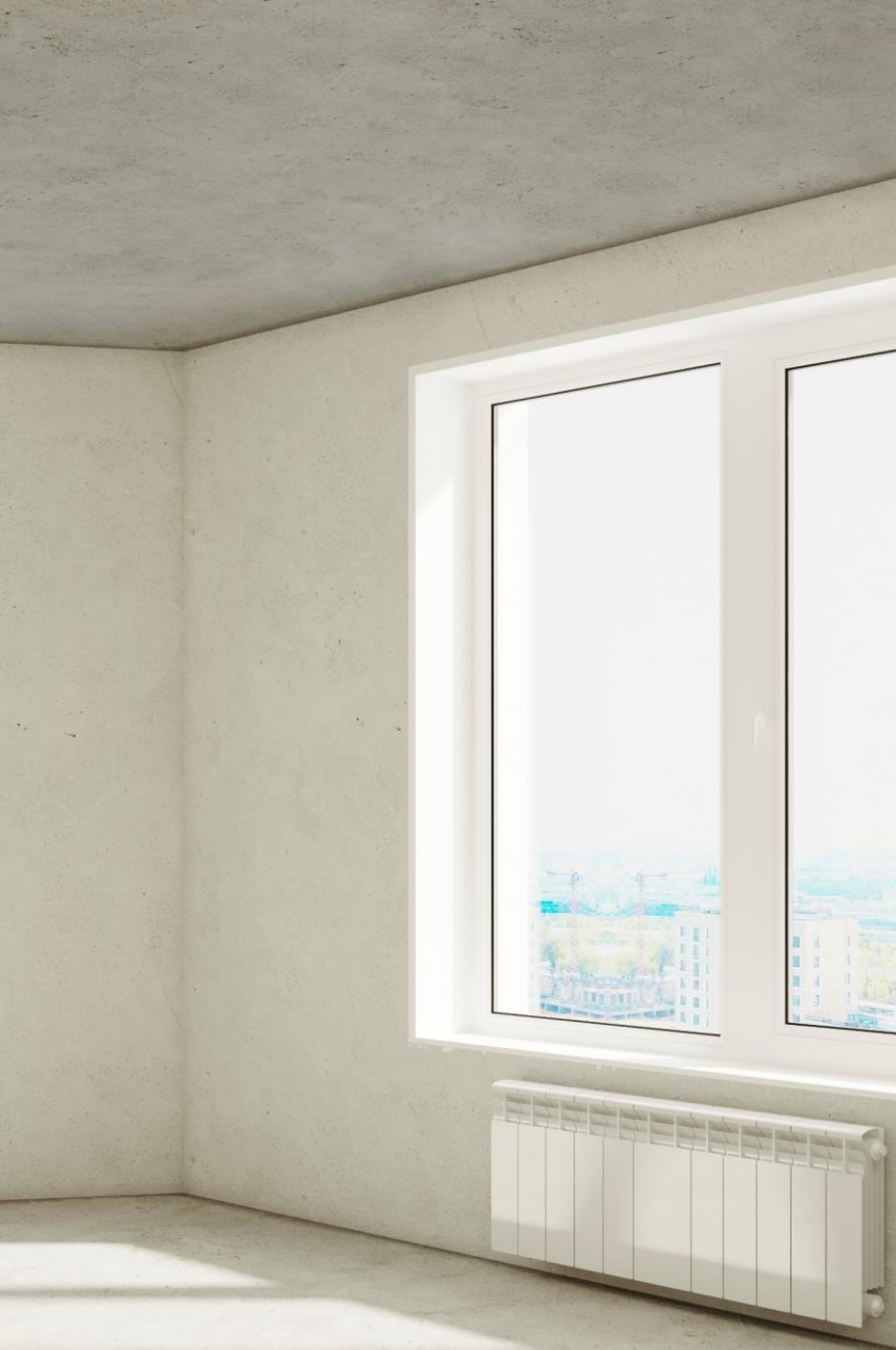
АПАРТАМЕНТЫ С ОТДЕЛКОЙ WHITE BOX