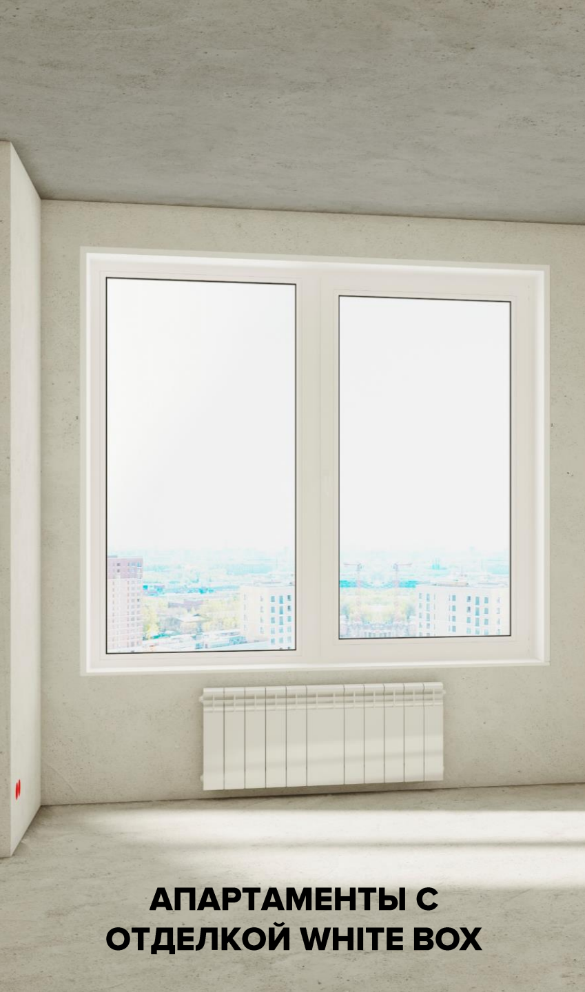
АПАРТАМЕНТЫ С ОТДЕЛКОЙ WHITE BOX

Апартаменты с отделкой WHITE BOX позволяют: